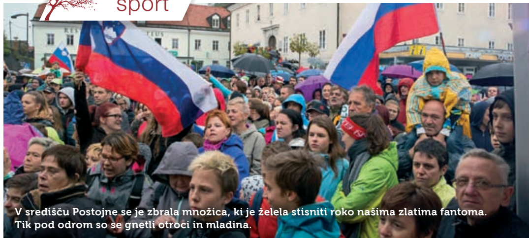
V središču Postojne se je zbrala množica, ki je želela stisniti roko našima zlatima fantoma. Tik pod odrom so se gnetli otroci in mladina.