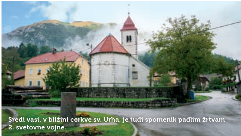
Sredi vasi, v bližini cerkve sv. Urha, je tudi spomenik padlim žrtvam 2. svetovne vojne.