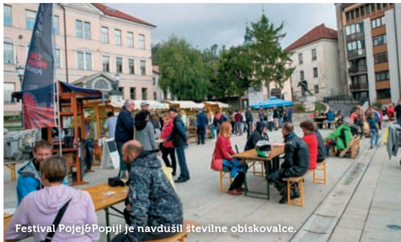
Festival Pojej&Popij! je navdušil številne obiskovalce.