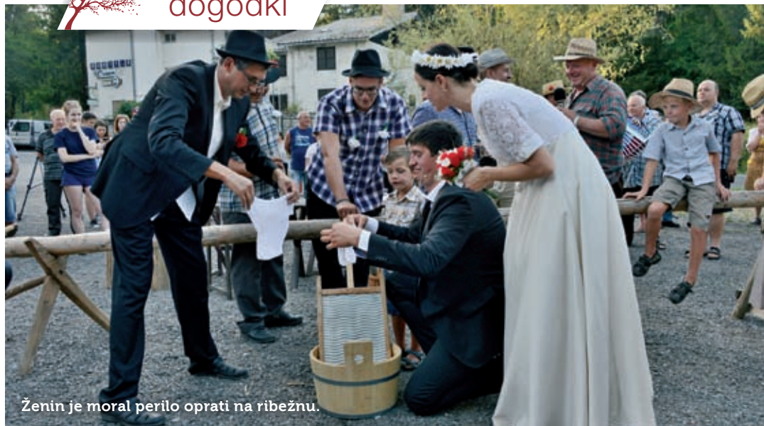
Ženin je moral perilo oprati na ribežnu.