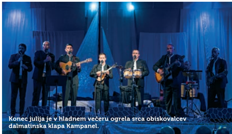
Konec julija je v hladnem večeru ogrela srca obiskovalcev dalmatinska klapa Kampanel.

Besedilo: Ester Fidel; fotografija: Florijan Poljšak.