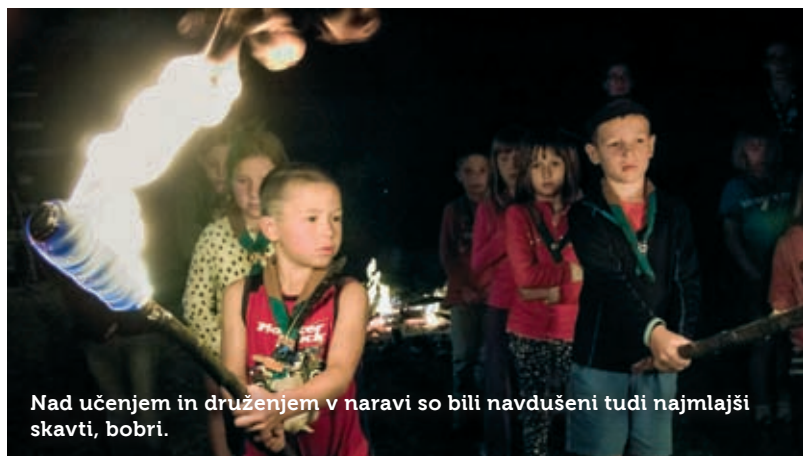
Nad učenjem in druženjem v naravi so bili navdušeni tudi najmlajši skavti, bobri.