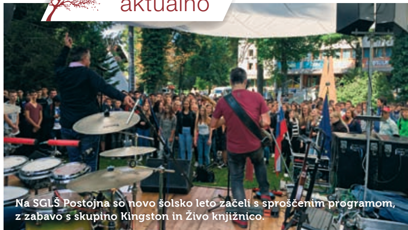
Na SGLŠ Postojna so novo šolsko leto začeli s sproščenim programom, z zabavo s skupino Kingston in Živo knjižnico.