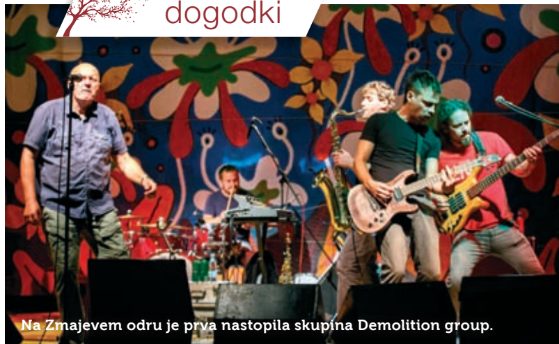
Na Zmajevem odru je prva nastopila skupina Demolition group.