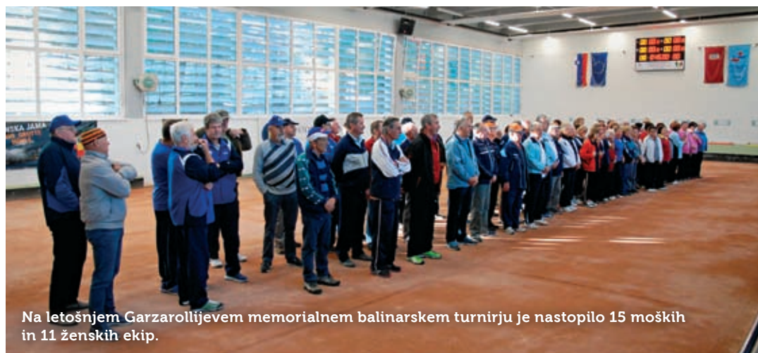
Na letošnjem Garzarolijevem memorialnem balinarskem turnirju je nastopilo 15 moških in 11 ženskih ekip.