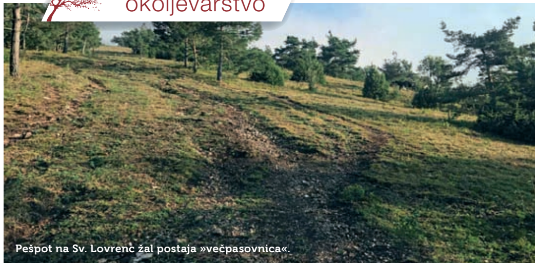
Pešpot na Sv. Lovrenc žal postaja »večpasovnica«.