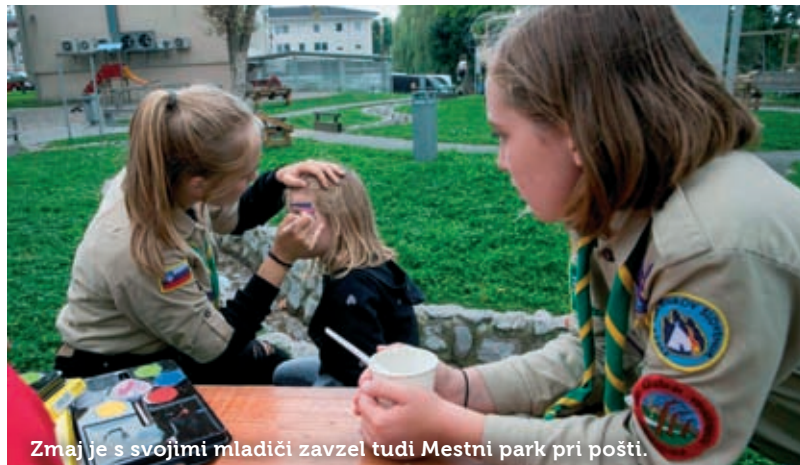
Zmaj je s svojimi mladiči zavzel tudi Mestni park pri pošti.

mlade. Tržnica nevladnih organizacij Po-stoj na živi ulici je že tretje leto zapored na trge in ulice v središču Postojne pritegnila veliko obiskovalcev. Letos so jo organizatorji