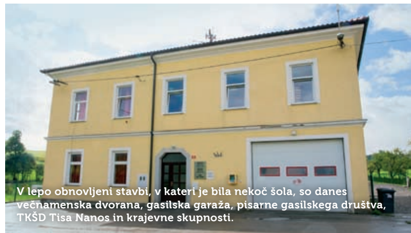
V lepo obnovljeni stavbi, v kateri je bila nekoč šola, so danes večnamenska dvorana, gasilska garaža, pisarne gasilskega društva, TKŠD Tisa Nanos in krajevne skupnosti.

Moramo priznati, da se v malokateri vasi toliko poje, kar bi v šali lahko pripisali odmevom glasu od nano-