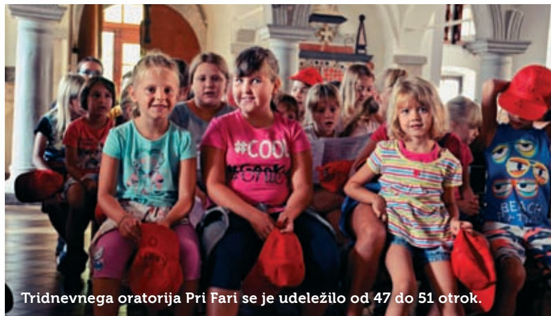
Tridnevnega oratorija Pri Fari se je udeležilo od 47 do 51 otrok.

vsako leto pet dni, letos med 26. in 30. junijem. Udeležilo se ga je 90 otrok, razdeljenih v devet različnih starostnih skupin. Zanje in za njihove organizirane dejavnosti je skrbelo