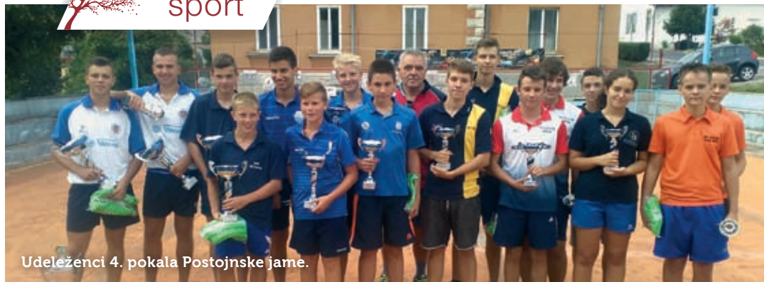
Udeleženci 4. pokala Postojnske jame.