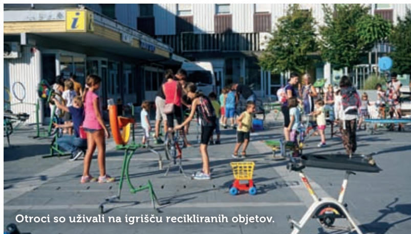
Otroci so uživali na igrišču recikliranih objektov.

Med kulturnimi prireditvami izpostavljamo tudi razstavo Naravnost v naravo, ki jo je avtorica,