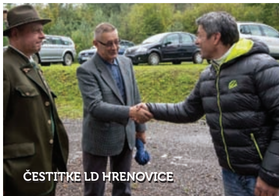
ČESTITKE LD HRENOVICE

Termin: oktober/november v SGLŠ Postojna. Z usposabljanjem pridobite pedagoško-andragoško usposobljenost za delo z dijaki in/ali študenti na delovnem mestu ter izboljšate kompetence na področju mentorstva. Informacije in prijave: www.usposabljanje-mentorjev.si , preko e-pošte na rotfranc@gmail.com , ali po pošti na naslov - Srednja gozdarska in lesarska šola Postojna, Tržaška 36, 6230 Postojna.