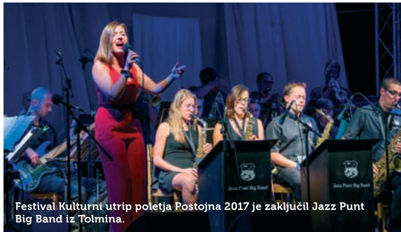
Festival Kulturni utrip poletja Postojna 2017 je zaključil Jazz Punt Big Band iz Tolmina.