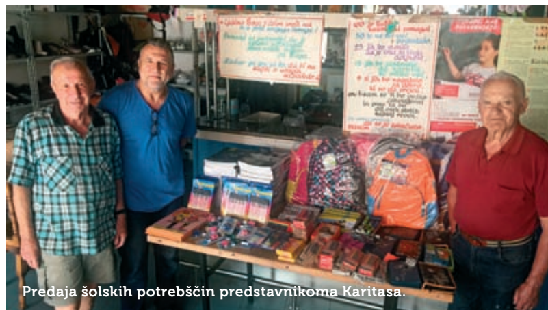
Predaja šolskih potrebščin predstavnikoma Karitasa.

žu v vrednosti dobrih 2600 evrov. Druga akcija, katere nosilec je prav tako papirnica Kocka Scripta, pa že deset let poteka v sodelovanju z Rdečim križem in medijskim pokroviteljem Radiem 94 . Tudi v tej akciji zbirajo šolske potrebščine in k sodelovanju povabijo obiskovalce