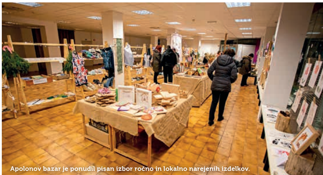
Apolonov bazar je ponudil pisan izbor ročno in lokalno narejenih izdelkov.

Društvo Lokalc veseli, da so se tokrat odzvali na povabilo k sodelovanju pri soustvarjanju programa pivška Hiša kulture, Destilator, društvo Hnum in Postojnska godba . Tako je sejem na enem mestu ponudil pisan izbor ročno in lokalno narejenih izdelkov, malih pozornosti in izvirnih darilc, ki združujejo znanje, ljubezen, izkušnje in inovativnost domačih ustvarjalcev. Ime je dobil po grškem bogu Apolonu, zavetniku kreativne umetnosti in ustvarjalnosti. Namen bazara je, da priložnostno spodbudi k sodelovanju in poveže različna društva, institucije ter posamezne umetnike, rokodelce in oblikovalce. Hkrati na enem