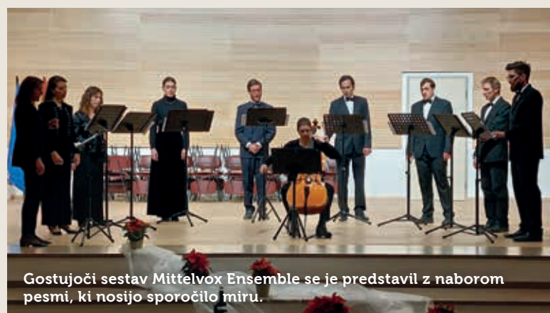
Gostujoči sestav Mittelvox Ensemble se je predstavil z naborom pesmi, ki nosijo sporočilo miru.