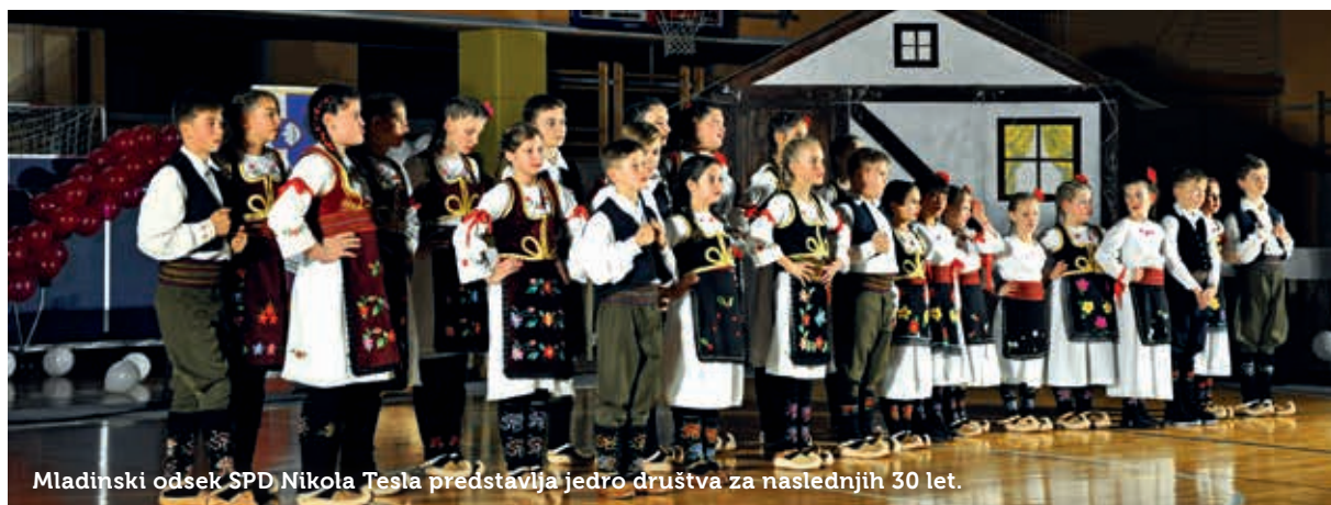
Mladinski odsek SPD Nikola Tesla predstavlja jedro društva za naslednjih 30 let.