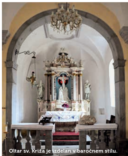
Oltar sv. Križa je izdelan v baročnem stilu.