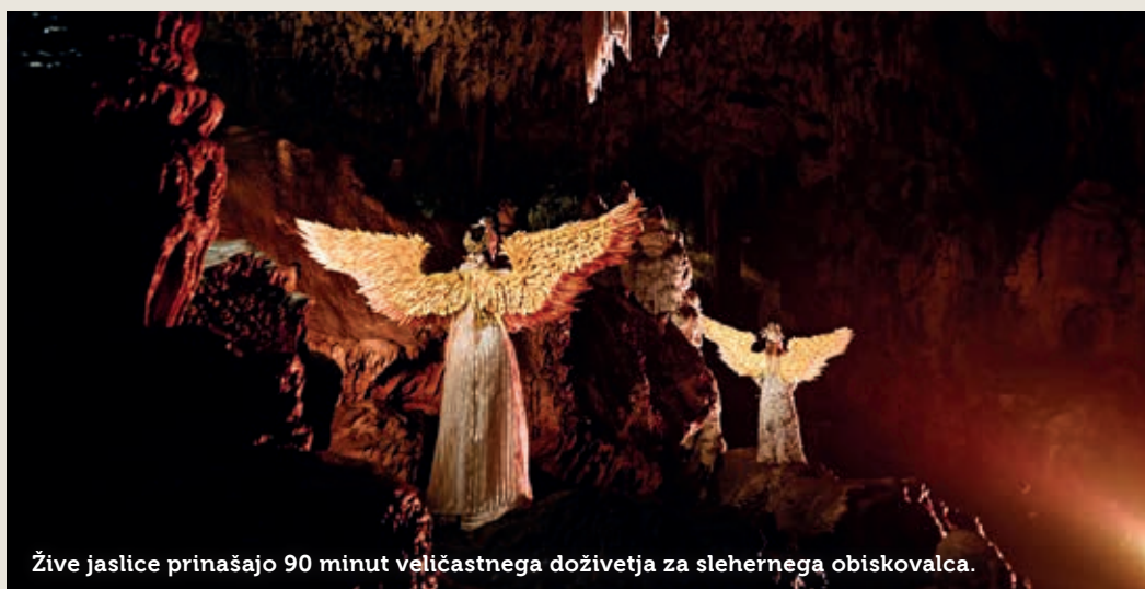
Žive jaslice prinašajo 90 minut veličastnega doživetja za slehernega obiskovalca.