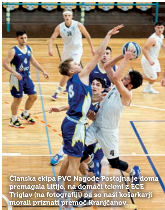
Članska ekipa PVC Nagode Postojna je doma premagala Litijo, na domači tekmi z ECE Triglav (na fotografiji) pa so naši košarkarji morali priznati premoč Kranjčanov.