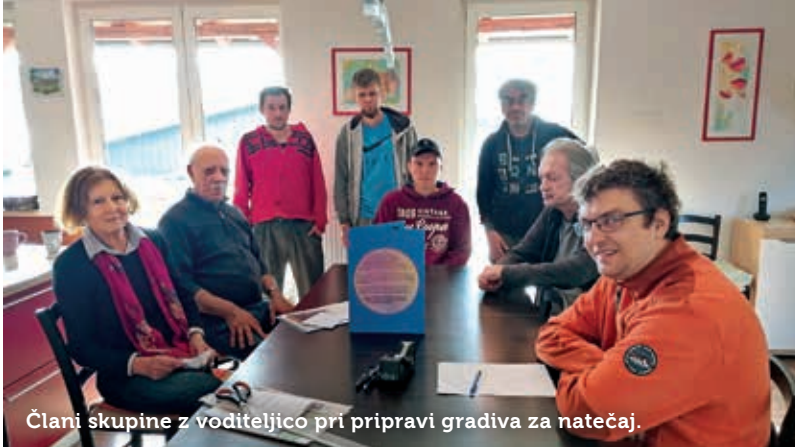
Člani skupine z voditeljico pri pripravi gradiva za natečaj.

Stanovanci bivalne skupine Društva »VEZI« iz Postojne so bili med trindvajsetimi prijavljenimi skupinami na natečaju »Drug z drugim«, ki ga je razpisala Zveza društev za socialno gerontologijo Slovenij, skupaj s skupino iz Trebnjega prvonagrajeni.