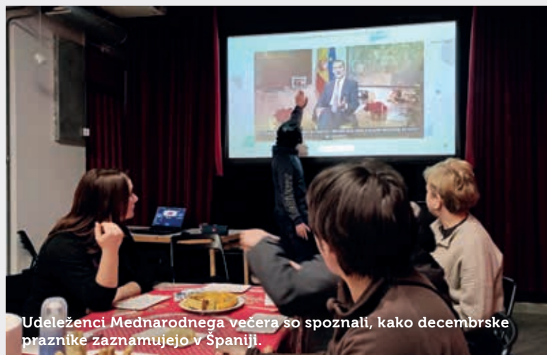
Udeleženci Mednarodnega večera so spoznali, kako decembrske praznike zaznamujejo v Španiji.