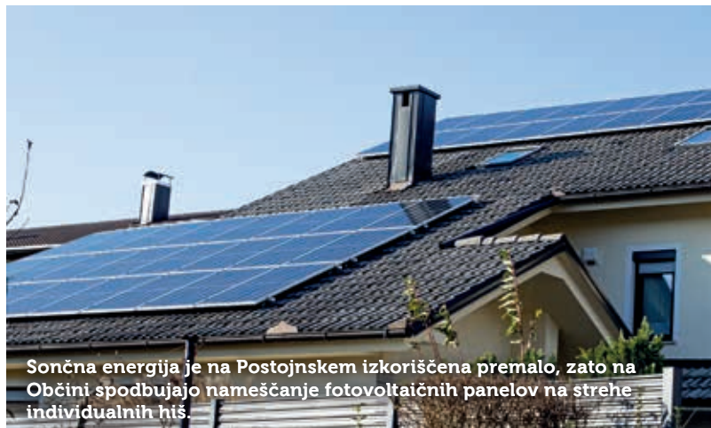
Sončna energija je na Postojnskem izkoriščena premalo, zato na Občini spodbujajo nameščanje fotovoltaičnih panelov na strehe individualnih hiš.

nega olja,« preračunava energetski svetovalec. Najdražje je ogrevanje s plinom propan-butan (UNP), zato so v mnogih večstanovanjskih hišah, kjer so se ogrevali na ta način, že prešli na katerega od cenejših načinov ogrevanja.