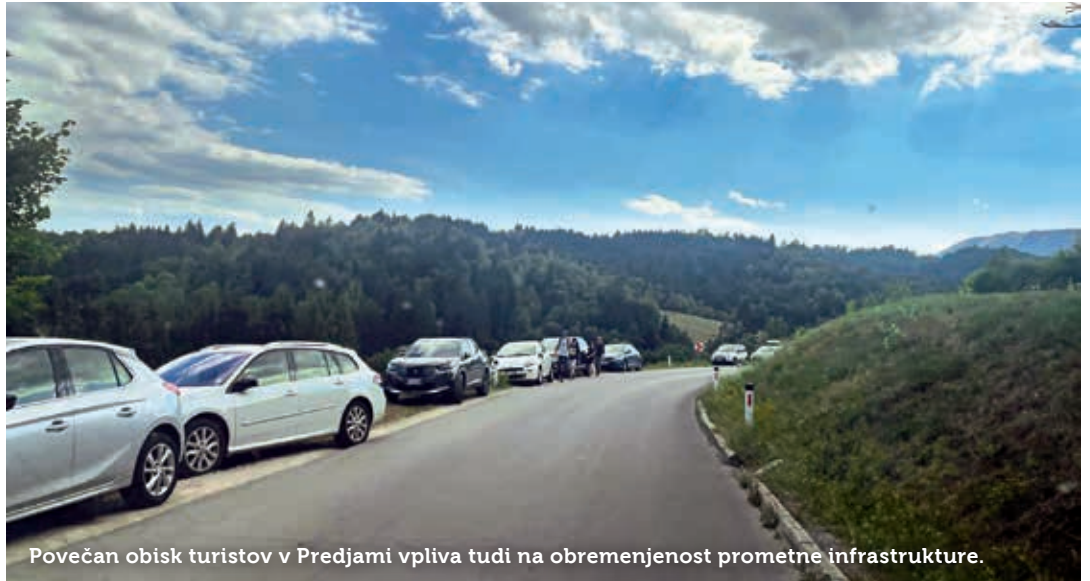
Povečan obisk turistov v Predjami vpliva tudi na obremenjenost prometne infrastrukture.

Postojnsko jamo je leta 2019 obiskalo okrog 900.000 ljudi, kar 300.000 jih je nadaljevalo