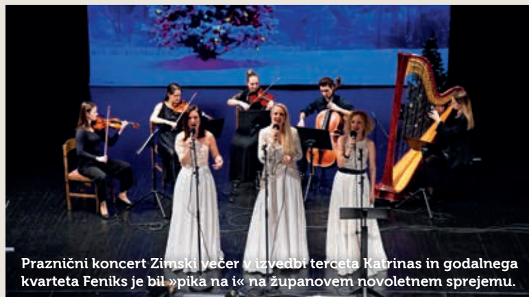
Praznični koncert Zimski večer v izvedbi terceta Katrinas in godalnega kvarteta Feniks je bil »pika na i« na županovem novoletnem sprejemu.

Njegove želje so se zlele z univerzalno umetnostjo, ki povezuje ljudi po vsem svetu in premaguje vse ovire – z glasbo. Tercet Katrinas