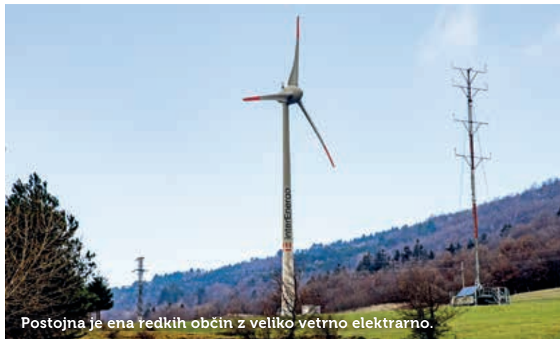
Postojna je ena redkih občin z veliko vetrno elektrarno.

V toplarni izgoreva les, ki sicer predstavlja odpad – veje, lubje, krošnje in odpadni gradbeni les, ki večinoma ostaja v gozdu. Kot še poudarja Dolenc, je njihovo podjetje dober primer krožnega gospodarstva, saj za vse, od surovine do končnega izdelka, poskrbijo sami. Na leto tako proizvedejo kar devet gigavatov energije.