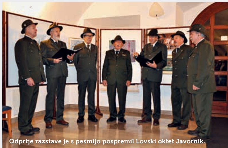
Odprtje razstave je s pesmijo pospremil Lovski oktet Javornik.

Na tokratni razstavi se z 22 deli predstavlja 11 članov društva in pet gostujočih ustvarjalok poletne likov-ne kolonije. O žanrski in tehnični raznolikosti razstavljenih del, med katerimi je tudi ena fotografija, je strokovno mnenje podala ume-tnostna kritičarka Polona Škodič . Obiskovalce je opozorila na različne pristope k občutenju, povezanosti