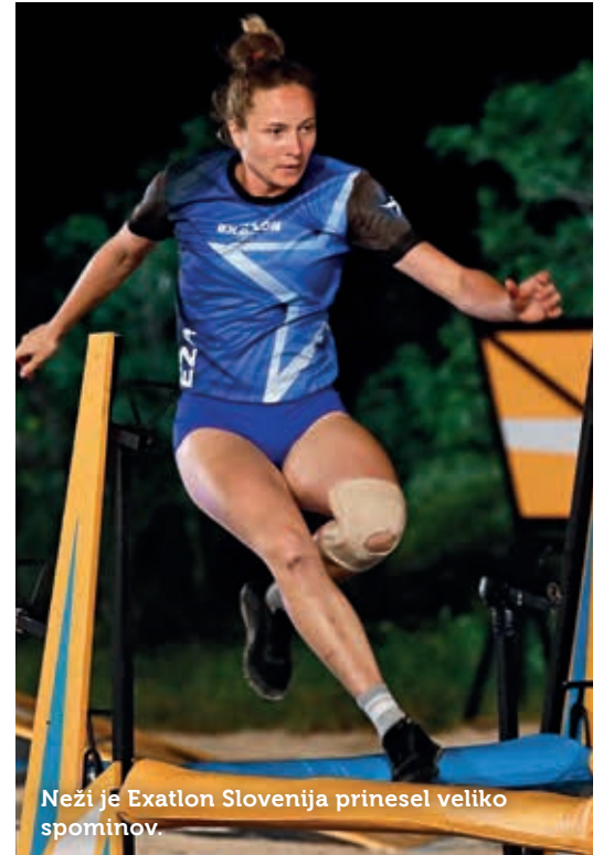
Neži je Exatlon Slovenija prinesel veliko spominov.

Televizijski šov ji je prinesel veliko spominov, še vedno pa jo nasmeji dogodek, ko so tekmoval-