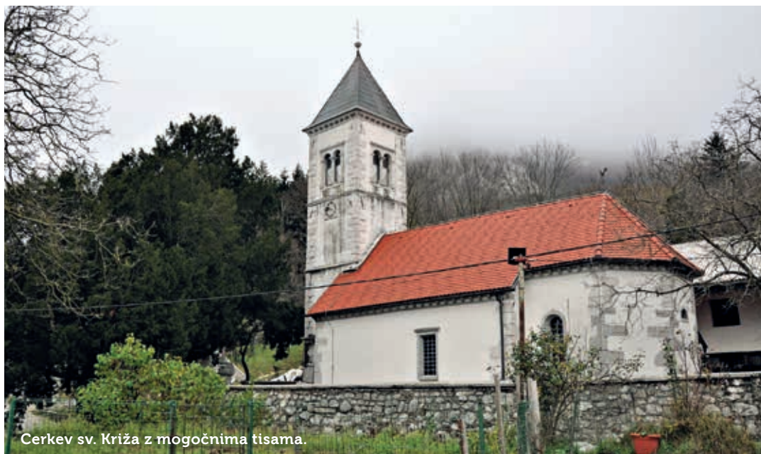
Cerkev sv. Križa z mogočnima tisama.

Zvonik se v pritličju odpira s tremi kamnitimi polkrožnimi vhodi, nadstropja pa so ločena z venčnimi zidci. Polkrožne vhode povezujejo železne vezi. V zahodni steni sta dve pravokotni lini, v