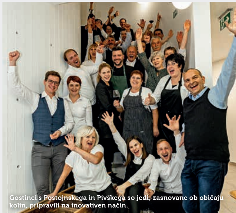
Gostinci s Postojnskega in Pivškega so jedi, zasnovane ob običaju kolin, pripravili na inovativen način.