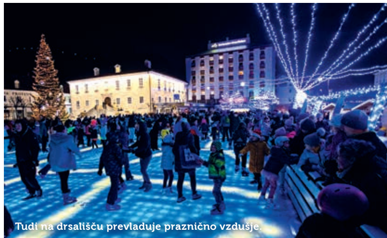
Tudi na drsališču prevladuje praznično vzdušje.

je (po dveh decembrih brez množičnih prireditev) pričarala posebno čarobno vzdušje. Občina je lučke za praznično okrasitev letos prvič najela in namenila nekoliko več sredstev, saj je sedaj okrašena tudi prenovljena Tržaška cesta. Osrednji mestni del je sicer letos okrašen v manjšem obsegu, a svetleča podoba je prenovljena, bogata in lično poenotena v belo.