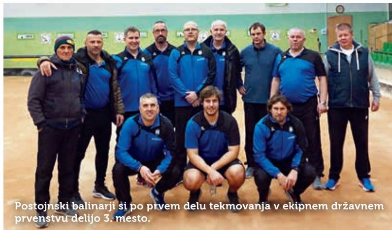
Postojnski balinarji si po prvem delu tekmovalja v ekipnem državnem prvenstvu delijo 3. mesto.