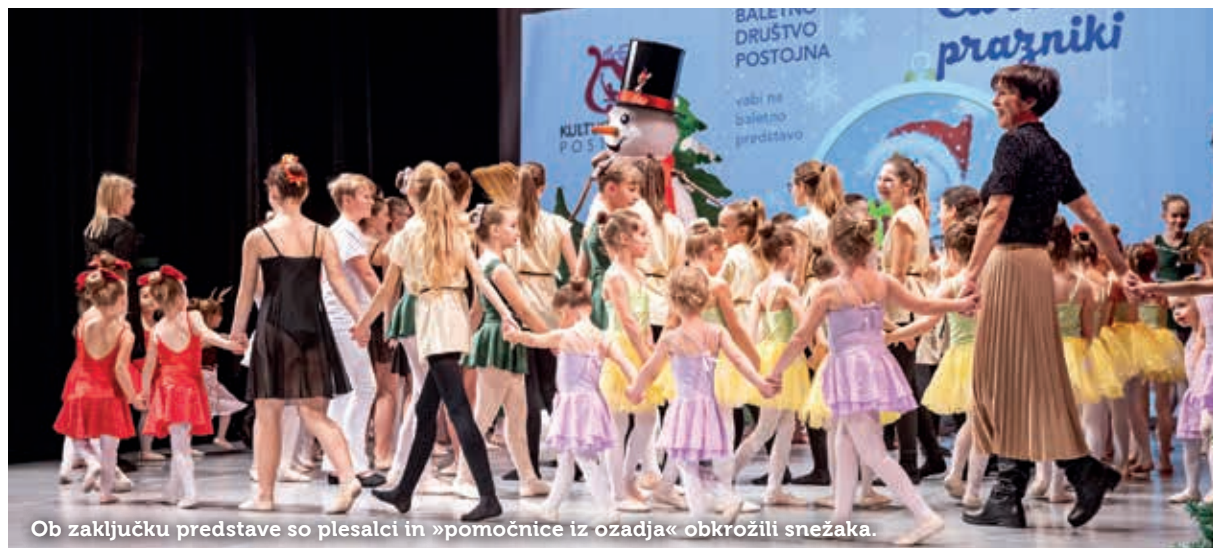
Ob zaključku predstave so plesalci in »pomočnice iz ozadja« obkrožili snežaka.

»V uvodnem delu predstave Sladkorna vila pričara čarobno vzdušje, v nadaljevanju privabi ples prvih snežink, zvončkov, lučk, jelenčkov, smrečic in drugih prazničnih motivov. Z baletnimi koraki plesalci prikazujejo veselo, očarljivo in svetlikajoče se zasneženo baletno predstavo,« je zasnovano baletne zgodbe predstavila njena režiserka Mira Marič . Na odru so se zvrstile skupine najmlajših (od 4-letnice dalje) do