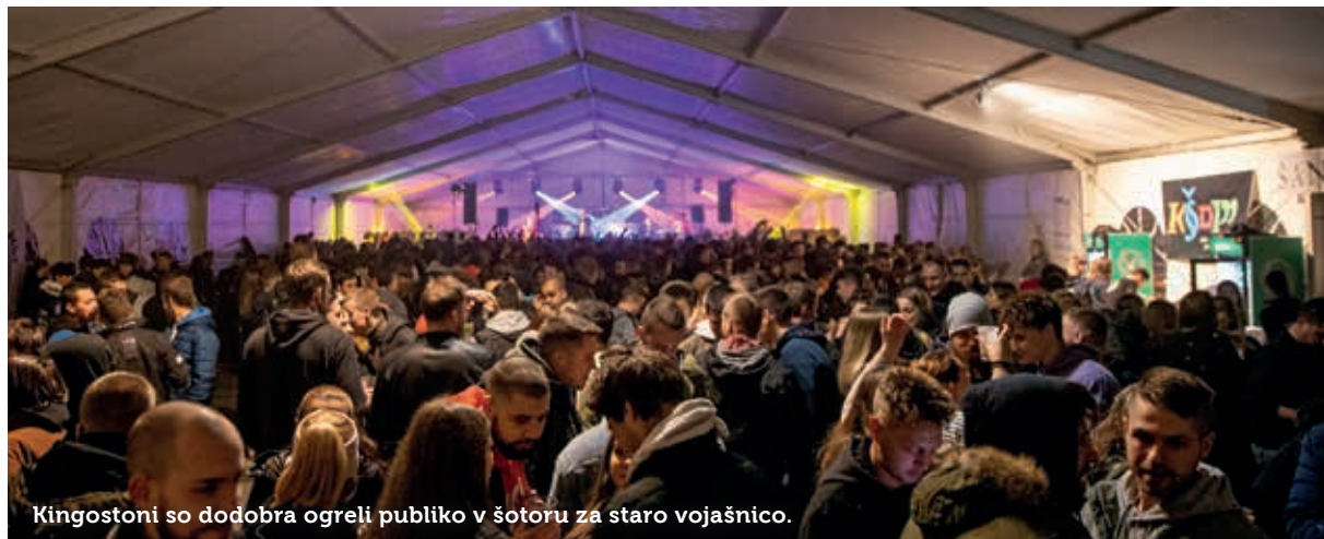
Kingstoni so dodobra ogreli publiko v šotoru za staro vojašnico.

Zadovoljstvo po uspešnem dogodku je 28. novembra skalil vlom v prostore lokalnega kluba. Nepridipravi so jim odnesli ves zaslužek letošnjega brucovanja. Kšopp je morebitne očividce zaprosil, da svoja opažanja