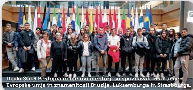
Dijaki SGLŠ Postojna in njihovi mentorji so spoznavali institucije Evropske unije in znamenitosti Bruslja, Luksemburga in Strasbourga.

Program, ki ga vodi Informacijska pisarna Evropskega parlamenta, je namenjen srednjim in poklicnim šolam po Sloveniji. Dijaki, ki v projektu pridobijo aktivno znanje o Evropski uniji in