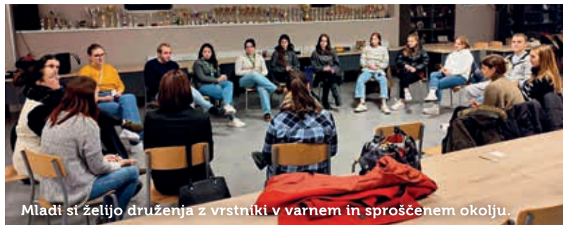
Mladi si želijo druženja z vrstniki v varnem in sproščenem okolju.

Mladinski občinski svet Občine Postojna je na svoji drugi seji razpravljal o preživljanju prostega časa mladih v Postojni, sodelovali pa so tudi drugi predstavniki mladinskih organizacij, organizacij za mlade, neorganizirane mladine, Občine Postojna in Komisije za mladinska vprašanja ter predstavniki list in strank.