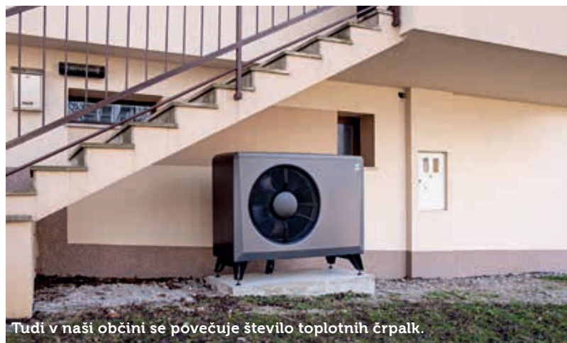
Tudi v naši občini se povečuje število toplotnih črpalk.

Besedilo: Mateja Jordan; fotografije: Mateja Jordan in Valter Leban.