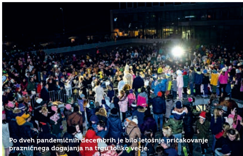
Po dveh pandemičnih decembrih je bilo letošnje pričakovanje prazničnega dogajanja na trgu toliko večje.

Letošnje odprtje veselega decembra na Titovem trgu v Postojni je po treh letih spet gostilo množico obiskovalcev. Dogodek, ki je združil prižig prazničnih lučk, prihod Miklavža in odprtje mestnega drsališča, je bil zaradi dežja sicer prestavljen s 5. na 6. december, zato smo še z večjim navdušenjem čakali Miklavža ter glasno odštevali do slavnostnega prižiga nove osvetlitve in odprtja atraktivnega drsališča. Zavzeti drsalci so se ledene ploskve ob odprtju lahko naužili brezplačno.